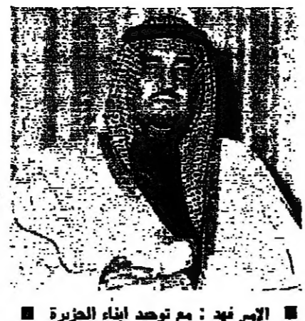
الامير فهد : مع توحيد أبناء الجزيرة

خلال زيارة الامير فهد بن عبد العزيز ولي العهد السعودي للكويت ، أدلى الامير بحديث صحفي تناول فيه مخلف القضايا العربية بشكل عام ، وقضايا الخليج بشكل خاص . وقال الامير فهد في حديثه ان السعودية ستؤيد اقابة دولة فلسطينية اذا رأى الفلسطينيون ان الوقت قد حان لذلك . وكذلك ستؤيد السعودية توحيد أبناء الجزيرة العربية في مختلف المجالات ، ووضع المملكة الجغرافي يلقى عليها التزامات كبيرة .